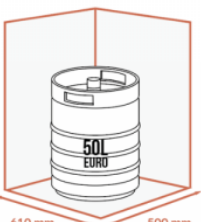
JUSQU'À 1 X 50 LITRES EURO