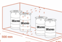
JUSQU'À 2 X 2 X 30 LITRES KEYKEG