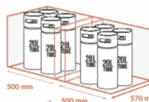
JUSQU'À 2 X 4 X 20 LITRES TUBE