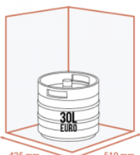
JUSQU'À 1 X 30 LITRES EURO