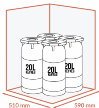
JUSQU'À 4 X 20 LITRES KEYKEG