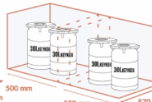
500 mm 500 mm 570 mm JUSQU'À 2 X 2 X 30 LITRES KEYKEG