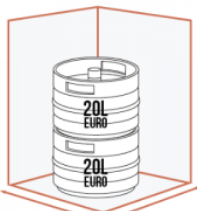
610 mm 500 mm JUSQU'À 2 X 20 LITRES EURO SUPERPOSÉS