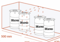
500 mm 500 mm 570 mm JUSQU'À 2 X 2 X 30 LITRES KEYKEG