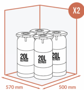
JUSQU'À 8 X 20 LITRES KEYKEG